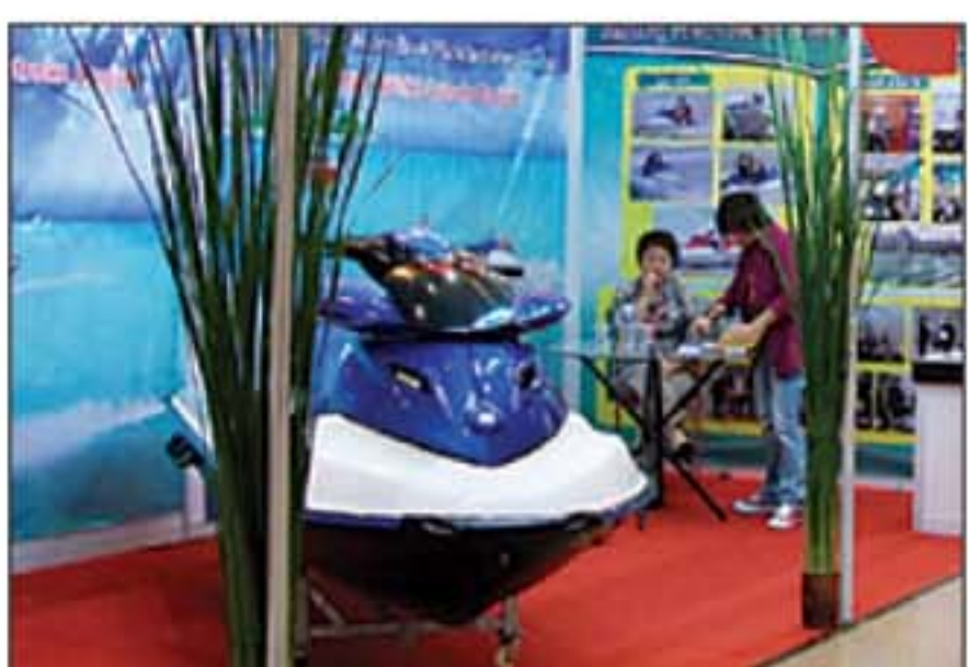
MEWAH: Produk speedboat asal Tionghok juga diminati.