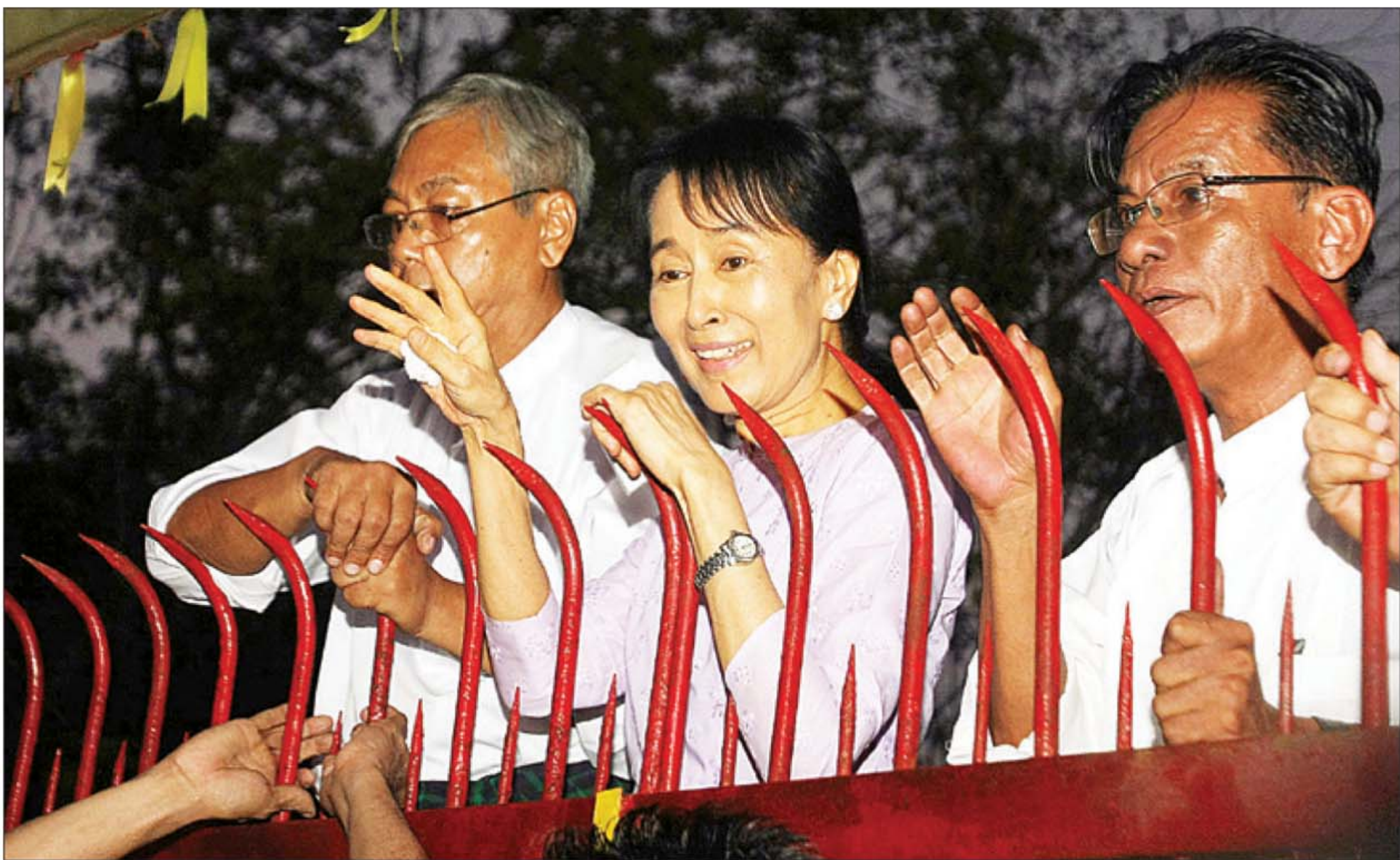
BEBAS: Aung San Suu Kyi (tengah) melambaikan tangannya kepada para pendukungnya di Yangon, kemarin.