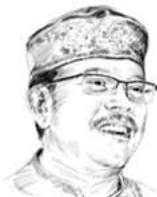
Oleh AGUS MUSTOFA