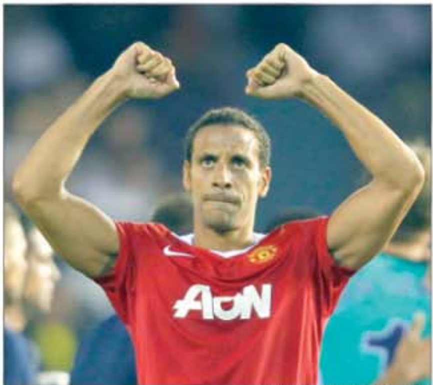
KECANDUAN TWITTER: Rio Ferdinand ketika menghadapi Valencia pada 29 September 2010.