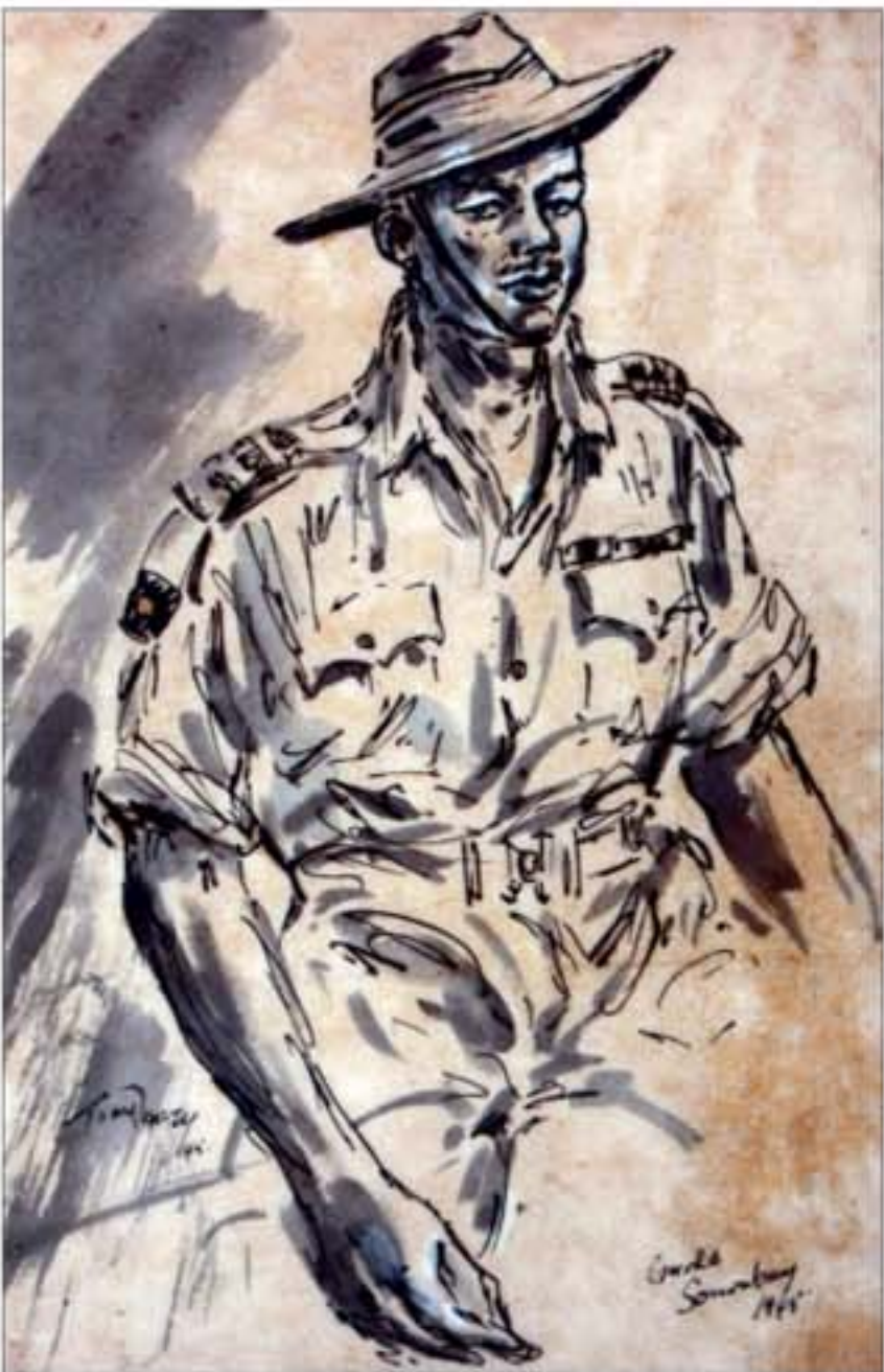
Gurkha Surabaya, karya Tony Rafty

Dalam pembukaan pamerannya di AJBS Gallery, Tony Rafty menyampaikan cerita itu dengan ekspresi pilu. "Tak ada seorang pun mau menyimpan memori perang dalam kepalanya. Perang itu mengerikan. Tugas saya sebagai jurnalis adalah merekam peristiwa itu. Tanggung jawab saya sebagai seniman sketsa ialah menggoreskan peristiwa dengan sapuan tinta secara jujur. Terserah apakah Anda sebagai orang yang tak pernah melihat peperangan itu mau mengapresiasi atau tidak. Saya hanya ingin