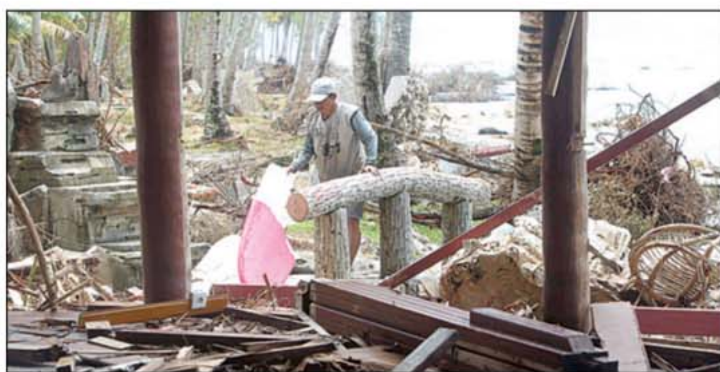
BERANTAKAN: Petugas memungut sisa papan surfing di reruntuhan villa.

Resor bernilai investasi Rp 20 miliar itu terletak di Tunang Siniai, bagian dari Dusun Silabu, Kecamatan Saumang-anyak, Mentawai. Pulau kecil itu diapit dua jenis laut. Di sisi belakangnya laguna hijau dengan ombak tenang dan pasir putih. Sisi yang lain berhadapan