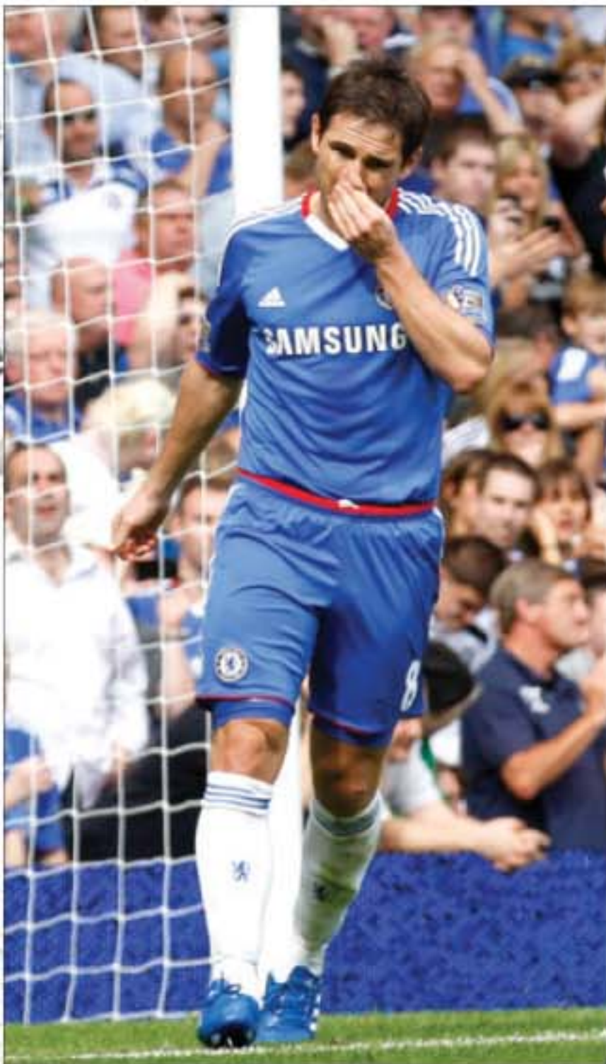
KAMBUH LAGI: Ekspresi Frank Lampard setelah gagal mencetak gol dari titik penalti ke gawang Stoke City.