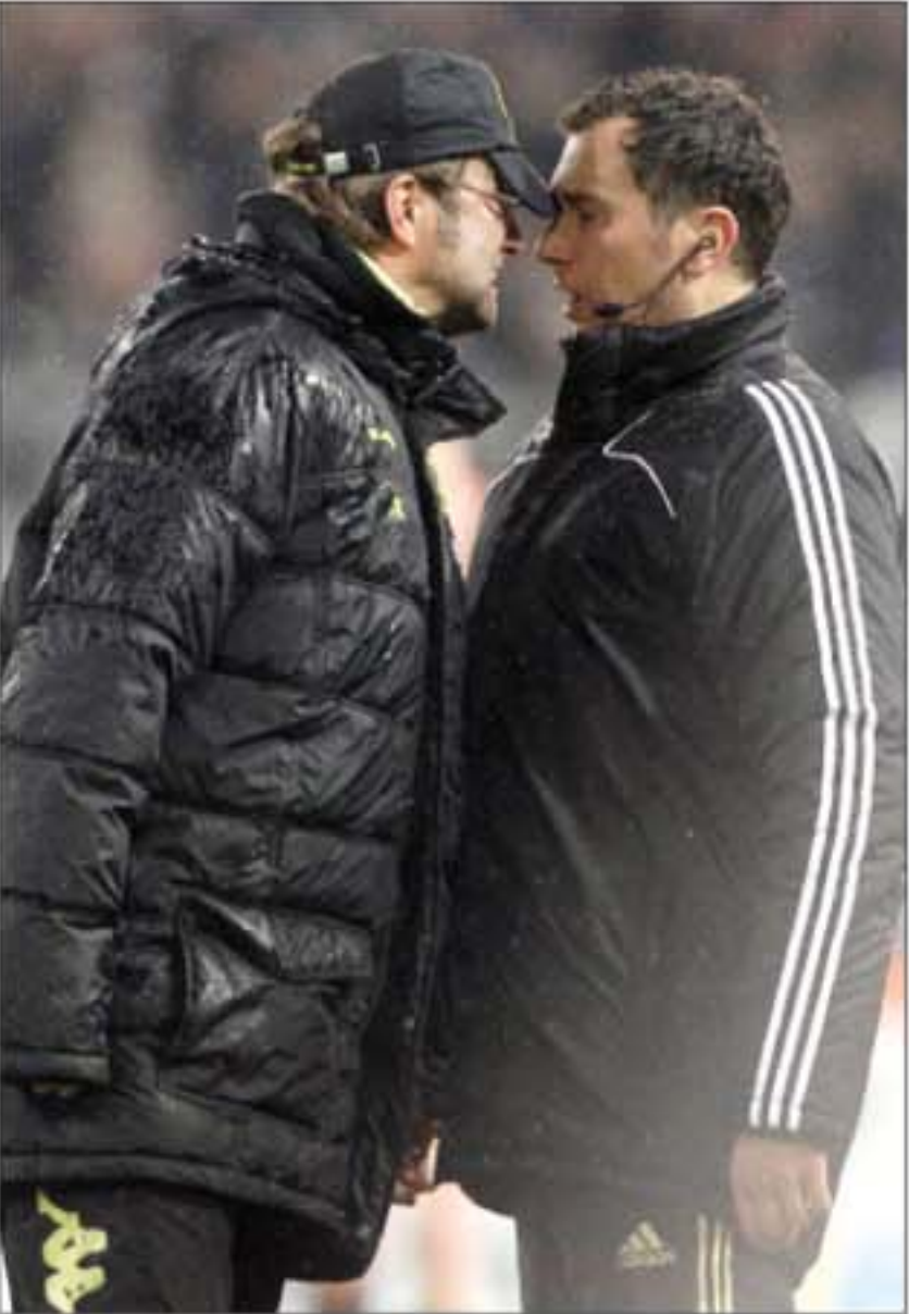
EMOSIONAL: Pelatih Dortmund Juergen Klopp (kiri) berdebat dengan wasit cadangan Stefan Trautmann dalam laga kemarin dini hari WIB.

Tapi, Armin Veh, pelatih Hamburg, tak sependapat. “Kami sudah melihat permainan mereka (Dortmund, Red) dan merasakan kekuatan mereka. Saya pikir, performa Dortmund sepanjang awal musim ini sangat hebat dan mereka bisa jadi juara,” kata pria yang mengantarkan VfL Wolfsburg merebut gelar Bundesliga pada musim 2008–2009 tersebut. (na/c13/ko)