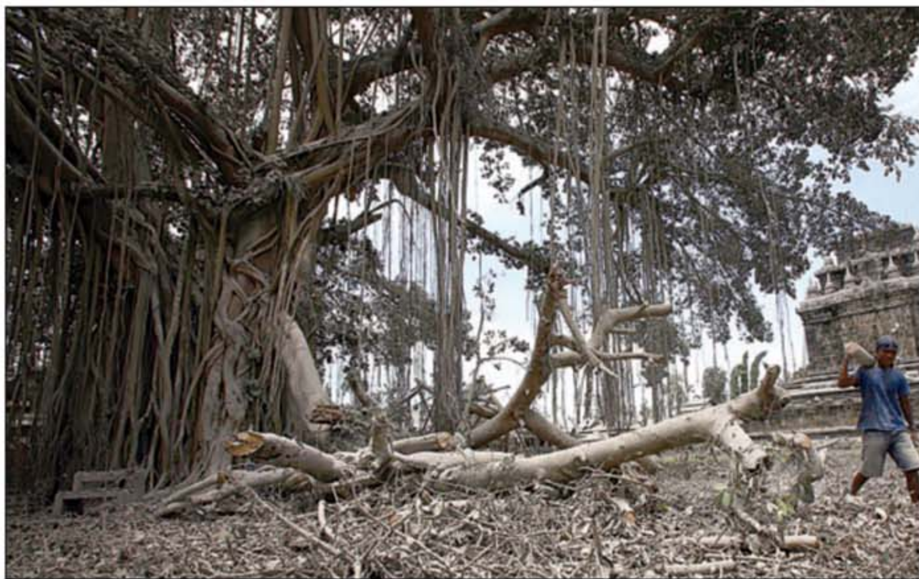
BERANTAKAN: Pekerja membersihkan pelataran Candi Mendut, Magelang, yang disiram abu vulkanik.