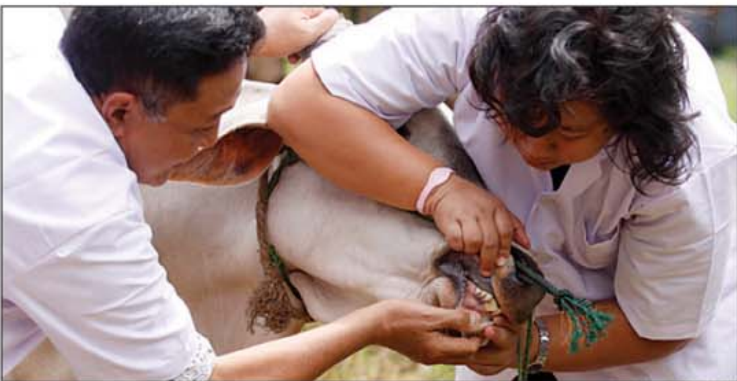
BEBAS PENYAKIT: Petugas Sudin Peternakan Jakpus memeriksa ternak kurban.