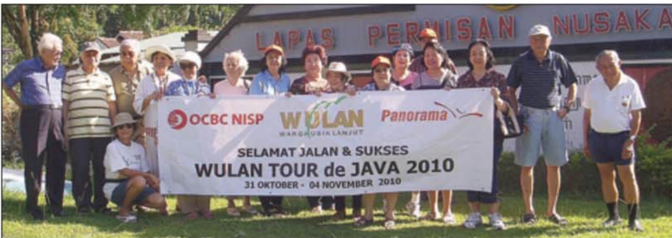
PUAS: Peserta Wulan Tour de Java berpose di halaman depan Lapas Permisan Pulau Nusa Kambangan.

Komunitas warga usia lanjut (Wulan) yang tergabung dalam Paguyuban Dharma Wulan kembali menggelar acara tahunan pada 31 Oktober hingga 4 November lalu. Yang menarik, komunitas ini menetapkan syarat istimewa, yaitu anggota Wulan yang sudah berusia di atas 60 tahun. Syarat lainnya mahl mampu menyendiri dan senang mengemudikan mobil untuk wisata bareng. Sambil berwisata, peserta dapat menghayati nikmatnya mengemudikan mobil dengan tertib, menaati peraturan dan rambu-rambu lalu-lintas, sekaligus menguji ketahanan fisik. Even itu diberi nama Wulan Tour de Java. Acara dilakukan setiap tahun dengan rutennya beda-beda setiap tahun. Pada 2008 mereka melewati rute Jakarta – Sarangan pp. Pada 2009, rute yang ditempuh adalah Banten melalui jalur selatan Malimping – Pelabuhan Ratu. Tahun ini, untuk kali ketiga, peserta dibagi dalam 5 etape. Etape 1: Jakarta – Tasikmalaya, rute