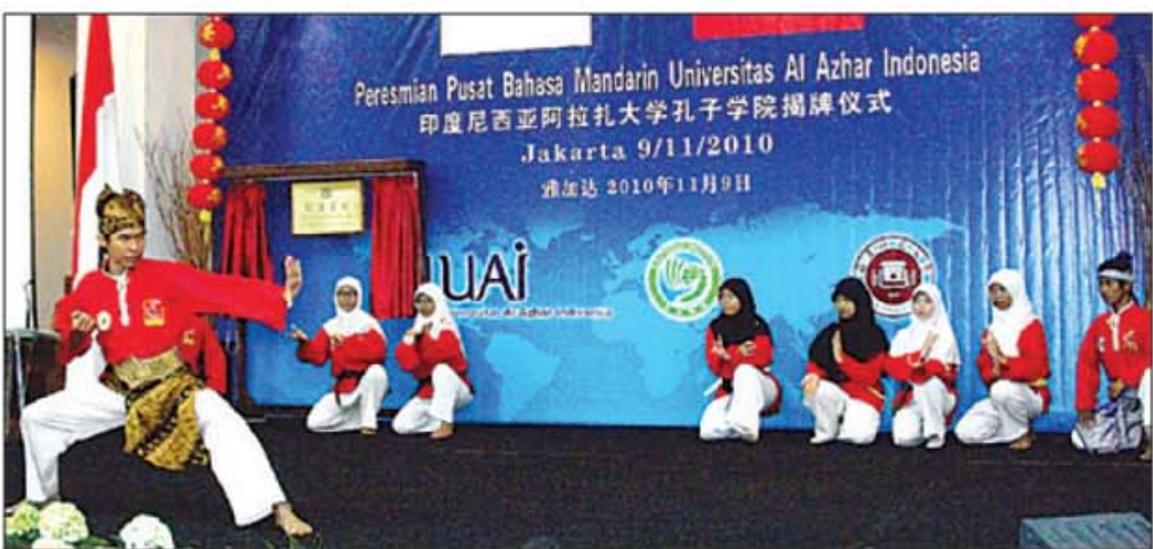
BUDAYA: Atraksi silat mahasiswa-mahasiswi Al Azhar Indonesia memukau delegasi Tionghok.

Kalau pertunjukan kung fu atau wushu selalu menarik perhatian masyarakat Indonesia, penampilan beladiri khas Indonesia pencak silat, tak ayal menarik perhatian tamu