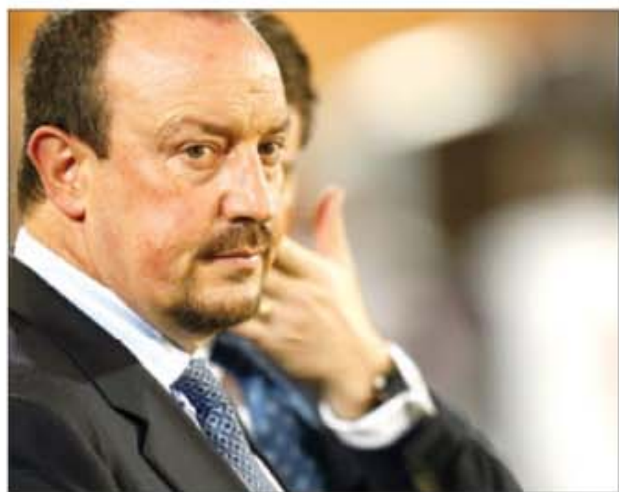
TERTEKAN: Rafael Benitez saat Inter Milan lawan Lecce.