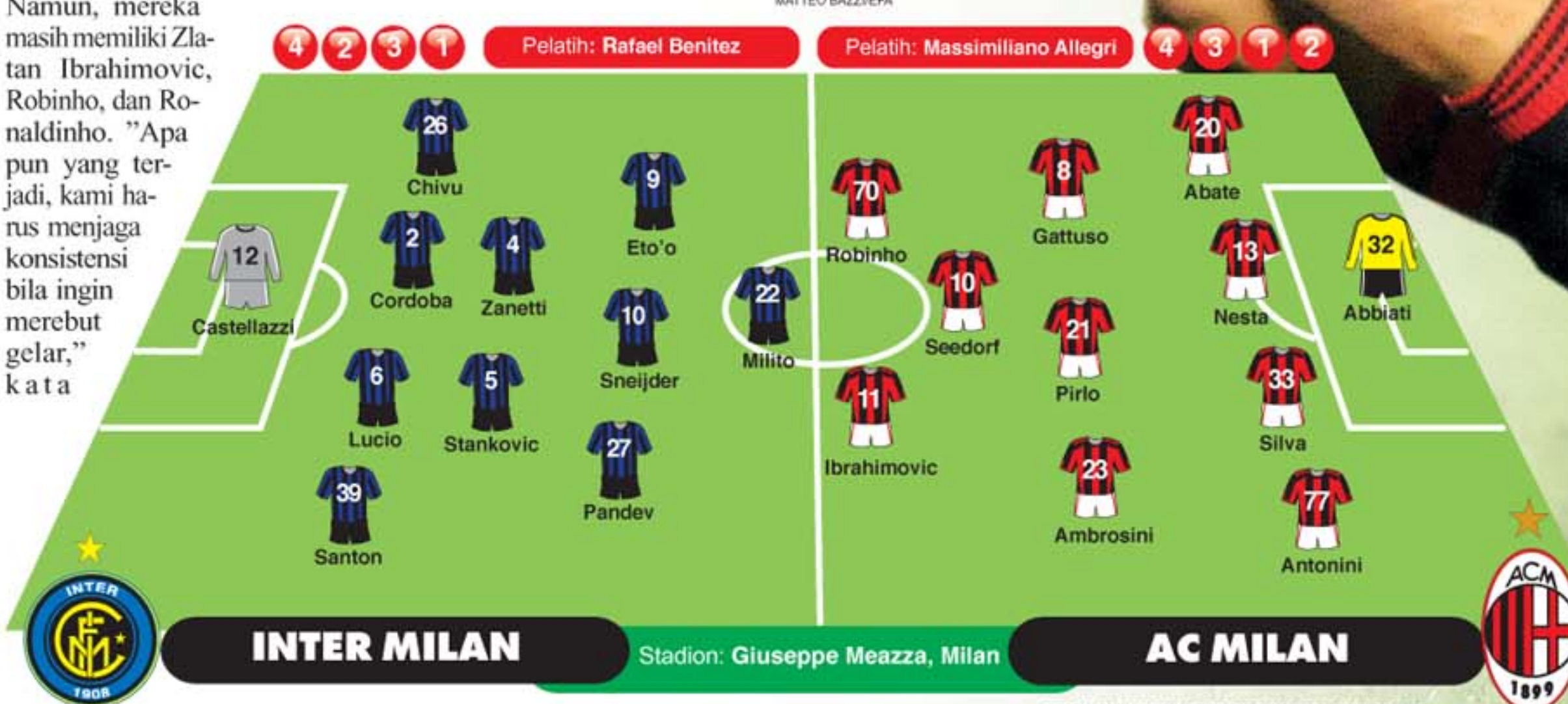
GRAFIS: BUDIONOUJAWA POS-FOTO: MARCO VASINI/AP PHOTO