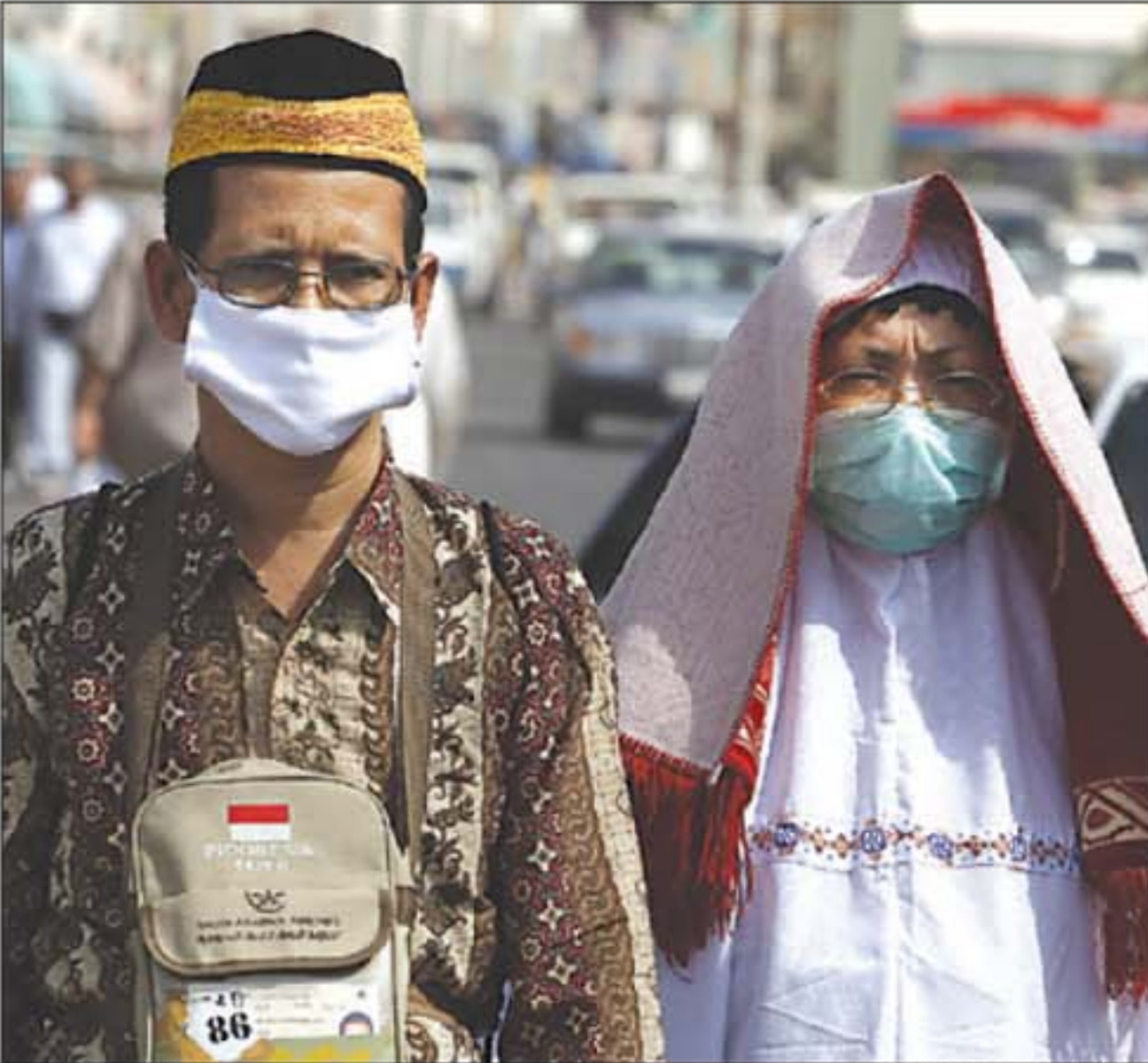
KHUSUK: Jamaah haji asal Indonesia akan menuju Arafah pada Senin besok.

Jamaah yang dirawat karena sakit 138 orang. Itu terdiri atas 91 jamaah yang dirawat di BPHI (Balai Pengobatan Haji Indonesia) dan 47