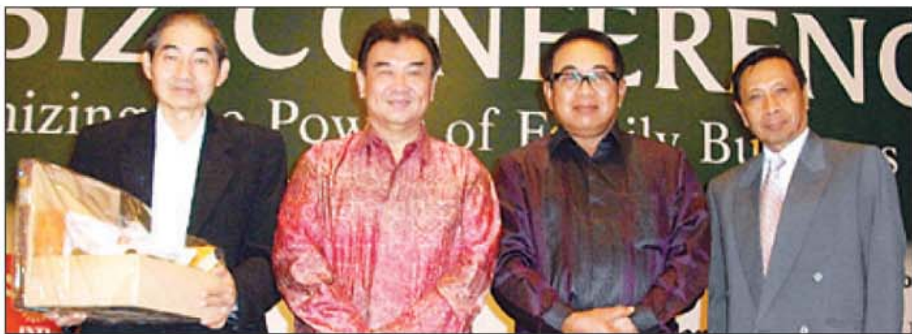
POSE: Beberapa pengusaha berfoto bersama usai mengikuti seminar Fambiz Conference yang digelar The Jakarta Consulting Group di Hotel Ritz Carlton, Jakarta belum lama ini.