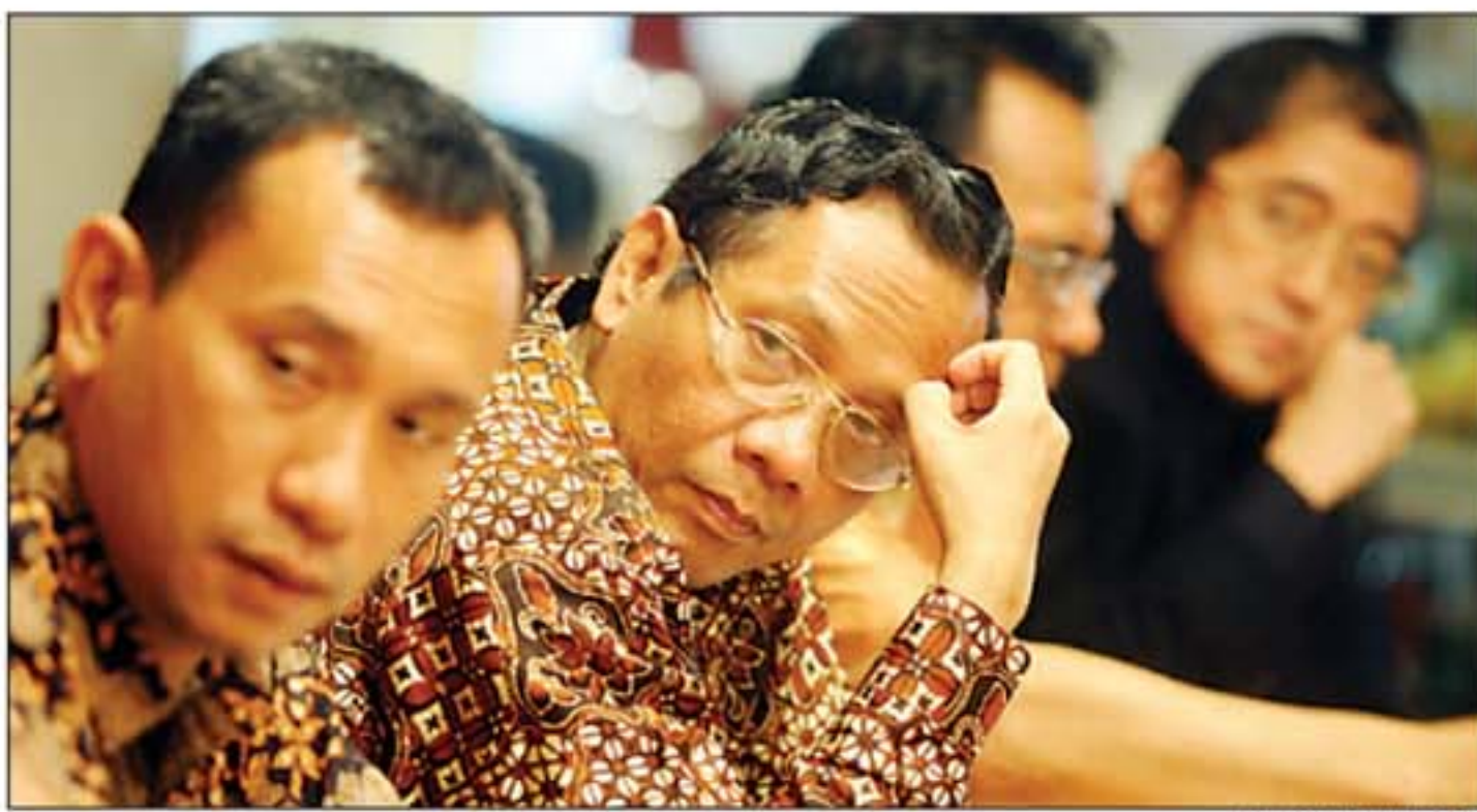
SERIOUS: Ketua Mahkamah Konstitusi Mahfud MD saat diskusi "Jaksa Agung dalam Kandungan", kemarin di Warung Daun Jakarta.