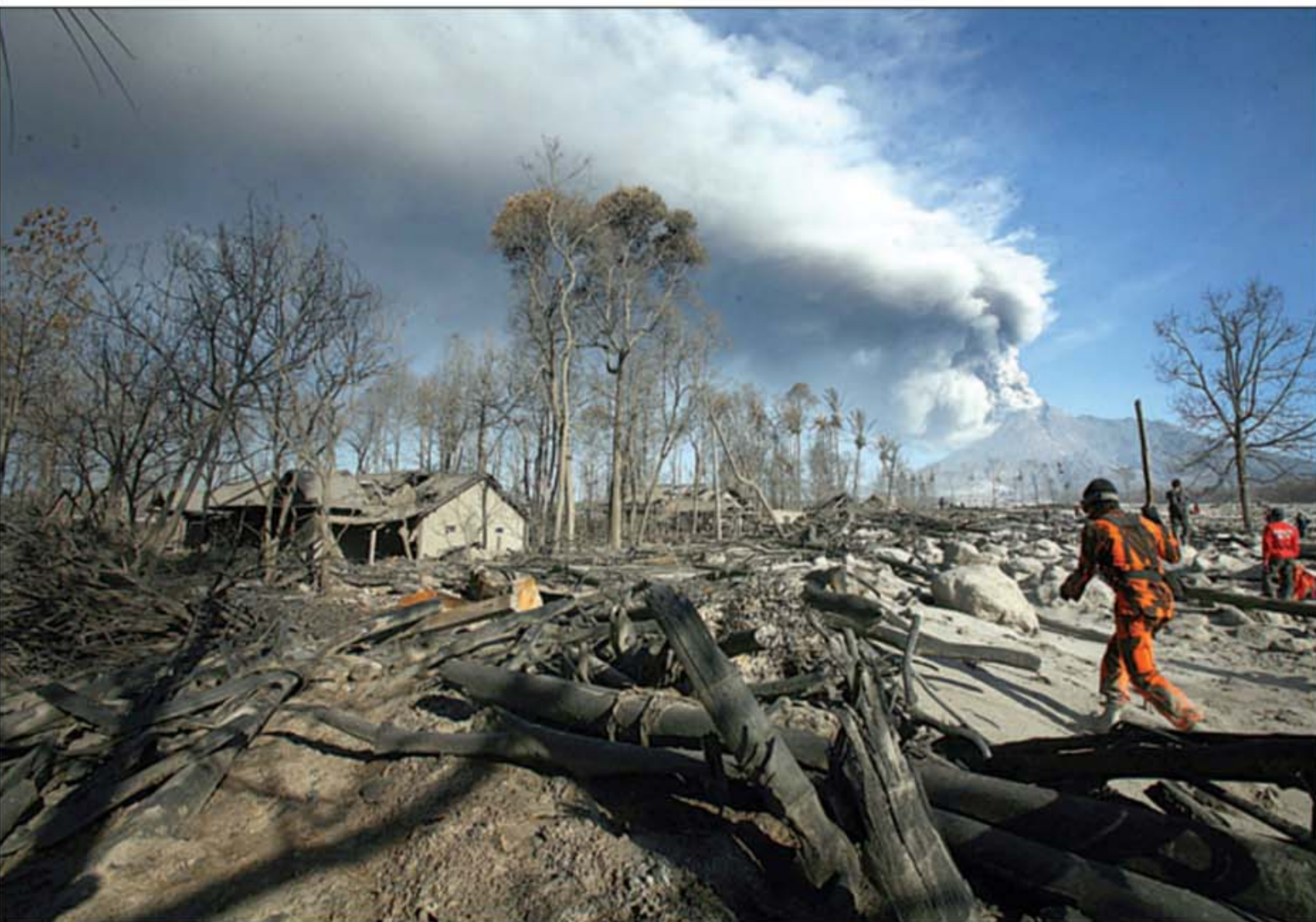
WEDUS GEMBEL: Tim SAR melakukan pencarian korban di Dusun Ngancar, Glagahrejo, Kecamatan Cangkringan, Kabupaten Sleman, (12/11).