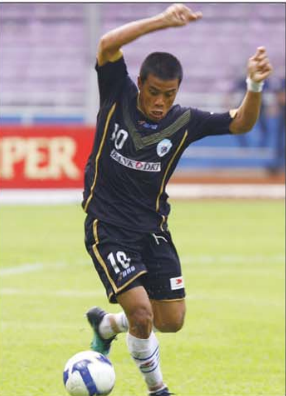
IKON: Tantan ingin bersikap profesional saat membela Batavia FC di ajang LPI.