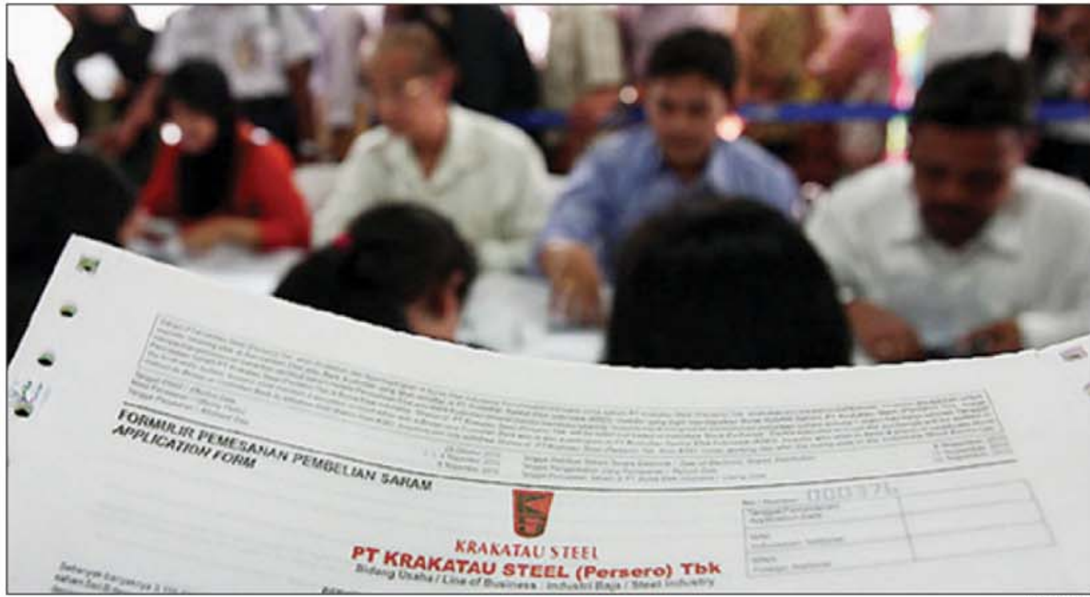
LARIS: Para peminat saham Krakatau Steel (KRAS) saat pra IPO. Walau penuh kontroversi, KRAS menjadi salah satu saham laris di lantai bursa.

Dia berharap, pembahasan syarat PT tidak menjadi debat kusir yang berkepanjangan. Paling tidak, pada masa persidangan II (22 November-17 Desember) nanti, Baleg bisa menyelesaikan RUU itu untuk menjadi RUU inisiatif. (bay)