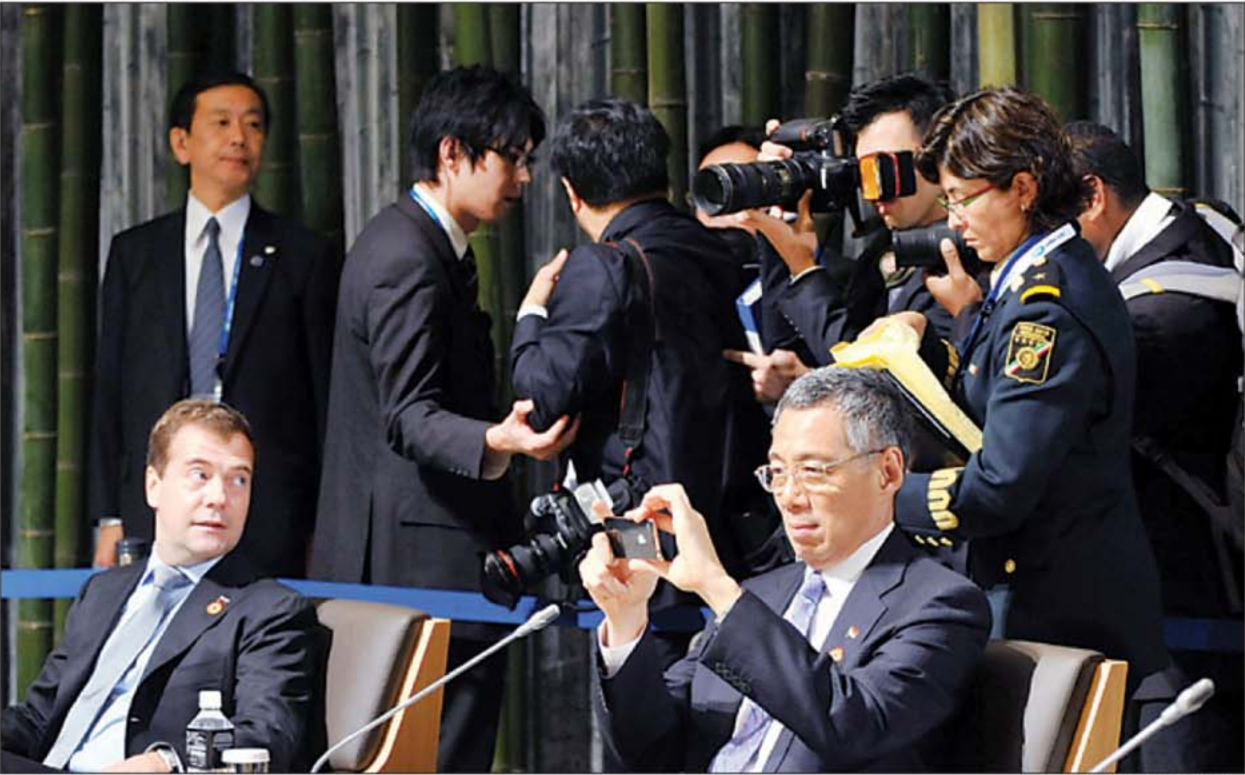
ABADIKAN MOMEN: PM Singapura Lee Hsien Loong mengambil gambar pertemuan KTT Kerja sama Ekonomi Asia Pasifik (APEC) di Yokohama, (13/11).

Kemarin SBY hanya sempat mengikuti dua sesi dalam pertemuan KTT APEC. Presiden