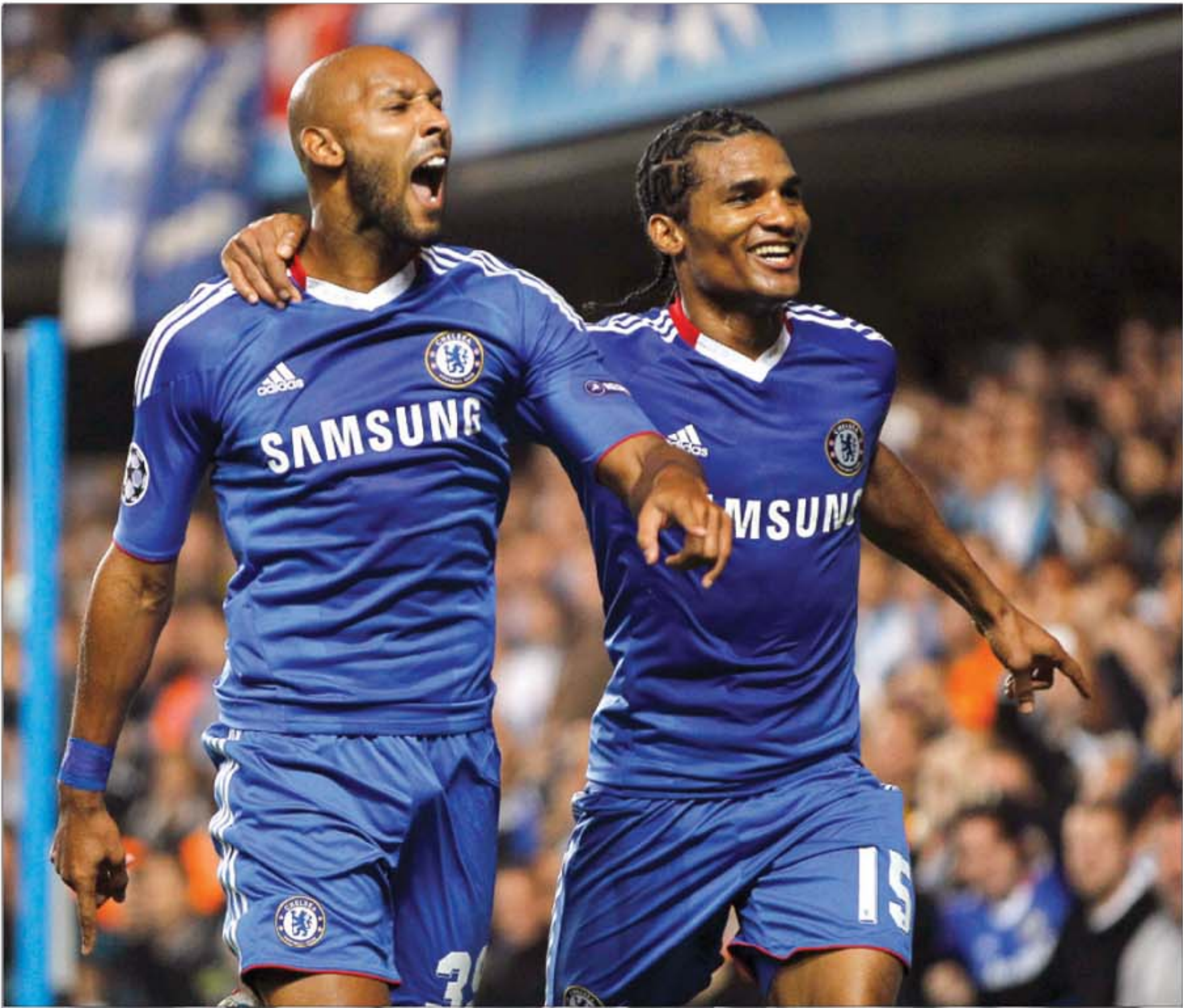
JAGA EUFORIA: Nicolas Anelka (kiri) merayakan golnya ke gawang Olympique Marseille di ajang Liga Champions.

APA hubungan Rio Ferdinand dengan situs jejaring sosial? Jawabannya sangat erat. Ferdinand mengatakan, dirinya kini tengah keranjingan Twitter . Bagi defender Manchester United itu, aktivitasnya di situs jejaring sosial tersebut memiliki banyak kegunaan. Salah satunya adalah sarana untuk menghapus luka hatinya setelah gagal membela timnas Inggris di Piala Dunia (PD) 2010. Ya, gara-gara didera cedera ligamen lutut, Ferdinand absen dalam ajang yang dihelat di Afrika Selatan (Afsl) pada 11 Juni-11 Juli lalu tersebut. Lebih apesnya, Ferdinand mengalami cedera ketika sudah menginjak Afsl atau hanya sepekan sebelum kick off di even empat tahunan tersebut. "Tidak ada yang lebih saya cintai kala itu, selain memimpin negara saya berlaga di Afsl. Hati saya pun hancur berkeping-keping ketika kehilangan kesempatan tampil di Piala Dunia," kata Ferdinand di Absolute Radio . "Tapi, berkat Twitter , saya tetap bisa menikmati perkembangan Inggris. Saya bisa tetap berhubungan dengan rekan setim. Juga beberapa fans Inggris yang saya kenal dan berada di sana. Itulah sebabnya, saya sangat kecanduan Twitter saat ini," sambung kapten timnas Inggris tersebut. Berkat Twitter pula, Ferdinand menerima banyak dukungan dari penggemarnya saat dibekap cedera. Perlu diketahui, Ferdinand memang termasuk pemain yang rentan dibekap cedera. Ferdinand menceritakan, hingga saat ini, dirinya memiliki 175 ribu followers . (dns/c6/bas)