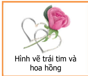
Hình vẽ trái tim và hoa hồng

Người Anh và Pháp đã tổ chức lễ này từ thời Trung cổ, nhưng đến thế kỷ 17, tập tục tặng thiệp làm bằng tay cho người yêu mới phổ biến. Hình ảnh thường thấy là hình trái tim, hoa hồng, mũi tên và vị thần tình yêu Cupid.