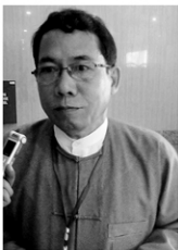
ဦးနု၊ အဲသလိုပဲ တပ်မတော်ဘက်က အမြင်နဲ့ သမ္မတအမြင်ကတော့မတူပါ။

ပြီးခဲ့သည့် ဧပြီလ (၁၀) ရက်နေ့က မြလုပ်မိသည့် ၆ ပွင့်ဆိုင်ဆွေးနွေးပွဲတွင် နိုင်ငံတော်သမ္မတဦးသိန်းစိန် ပြည်သူ့ လွှတ်တော်ကြီးတွင် သူရဲကောင်း အမျိုး သားလွှတ်တော်ကြီးနှင့် ဒီမိုကရေစီမြန်မာ ဝေါ်ဟောင်းဆန်းစစ်ကြည့်၊ တပ်မတော် တာဝန်ယူမှုဆန်းစစ်ချုပ်ဆိုလုပ်ချုပ်ဆို ပေးအောင်လိုက်နှင့် လွှတ်တော်အတွင်းရှိ တိုင်ကြားသောပါတီ ၁၂ ပါတီကိုယ်စားပြု ဝေါ်ဟောင်းအမေဇာတို့တွေ ဆုံးဖြတ် ဆုံးရှုံး အဆိုပါပစ္စည်းဆုံးဖြတ် ပါဝင်သူများနှင့် တပ်မတော်နိုင်ငံခြား၊ ဝေါ်ဟောင်းအမေဇာတို့အဆိုအရဆုံးချုပ်ဆိုသည်။