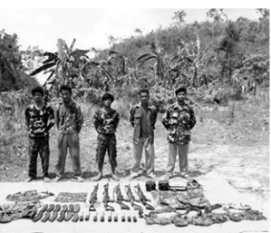
ရာ တိုက်ပွဲဖြစ်ပွားရာတွင် ပါဝင်သည့် သောင်ကျွန်းသို့မှာ ခိုအောင်းနေကြောင်း သောင်မြေပြည်သူများက သတင်းပေးကြောင်း အရ ဧပြီ ၁၉ ရက် နံနက်လွန်းလွန်းတွင် စစ် မိမိရဲ့ အနောက်ဘက်တောင်ပိုင်း ခို

တပ်မတော်စစ်ကြောင်းများကရခိုင် သောင်ကျွန်းသို့မှာ ခိုအောင်းနိုင်သော နယ်မြေများအား နှင်းလင်းဆောင်ရွက်