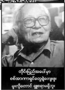
တိုင်းပြည်အပေါ်မှာ စစ်ဘက်ကိုင်တွေ့ခဲ့ရတဲ့အခါ မှုးလှတောင် ချစ်ရောမရှိဘူး

“ပြန်လည်ပြောင်းလဲတာ ခေါ် စကားပဲလို့တောင် တာကို ပန်းပိုင်ကြီးတွေ ချိတ်အားပေးသုံးခဲ့ရတယ်။ ပြန် ပြန်ကြည့်ရင် အားထက် လိုက်တာသုံးခဲ့ရတယ်။ သိရ အခုအခါမှာ ခေါ် စကားပဲဖြစ်တဲ့နောက် ခေါ် ပို တောင်ကိုလို့ အန်ကယ်ဦးတင်တွေ ဘယ်ရောက်သွား လာ” ဟို အန်ကယ်ကမေးတယ်။ ကျွန်တော်လည်း စစ်အစိုးရနဲ့ ပြန်ပြည်တစ်ခုလုံးကို ငြိမ်းငြိမ်း ပြန်ပေး နေအောင် ဖိနှိပ်ပုံတွေကို ပြောပြရတာပေါ့။ အဲဒီ တုန်းက MI 6 ဘူး သုံးရက်၊ နှစ်ခန့်မှာ နှစ်ရက်နေခဲ့ ရတဲ့အခါ အိမ်မေ့အကြောင်း အကဲဖြတ်ကြည့်ရင် ကျွန် တော်က အပြန်ဆုံးအိမ်လိုက်ခွင့်တာအမှန်ပါ။ ဒါပေမဲ့ ကျွန်တော်မတိုင်ရဘူး ကိုယ့်နေ့မှာထိုင်