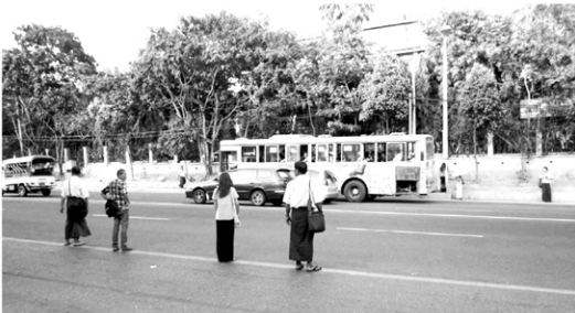
လာဘ် ကားတွေယာဉ်ကြောပေါင်းသွားတဲ့နေရာလည်းဖြစ်နေတယ်။ လမ်းကွေးတဲ့