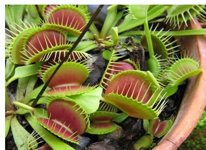
The Venus Fly Trap

This sends a signal to the trap and it snaps shut!